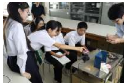
工学部での様子 プラズマボールを用いた電気実験

毎年1年生が新潟大学を訪問しています。今年は教育学部・理学部・工学部・農学部・災害復興科学研究所で様々な授業体験を行いました。体験を通して大学での学習に興味・関心を高めました。新潟大学の皆さんお世話になりました。ありがとうございました。