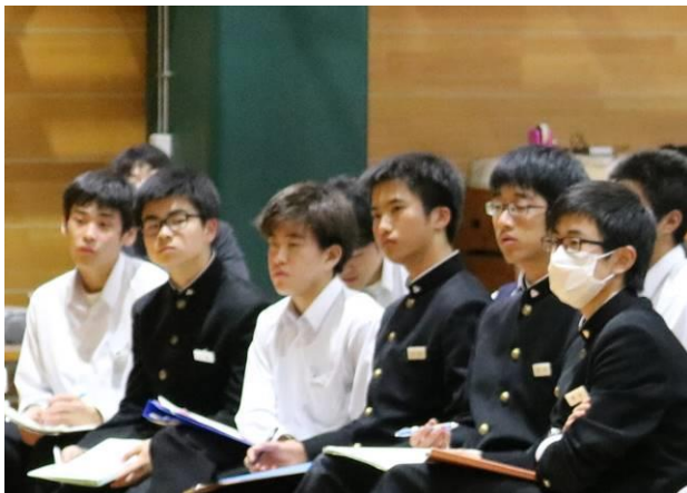
【聞く側の表情も真剣そのもの】