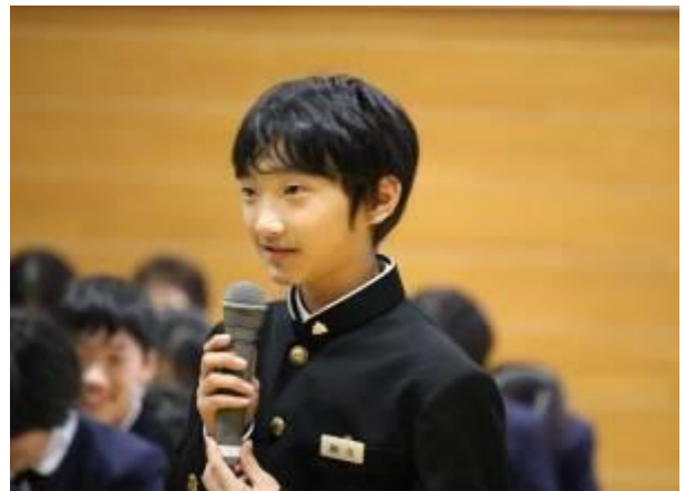
【自分なりの考えをもった率直な質問が印象的でした】

生徒の感想からは、様々な生命観に触れ、今後の学びの土台となる見方や考え方を得ている様子が見えます。参加された保護者の方からも、感想をお書きいただきました。一部をご紹介します。