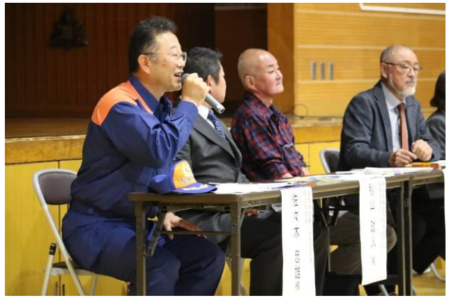
【4人のパネリストから、生徒に質問を投げ掛けてもらいました】