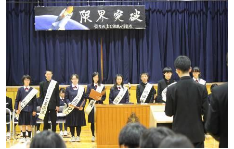
立会演説会の様子