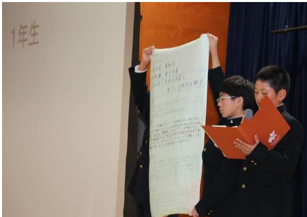
【ディスカッションに先立って、各学年の学習発表】